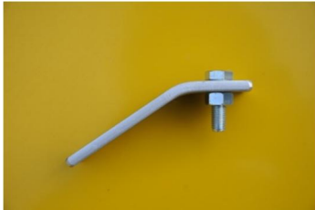
figuur 1 (ondersteun)