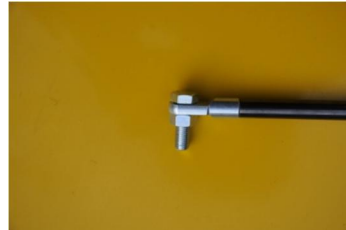
figuur 2 (bovenste bevestiging)