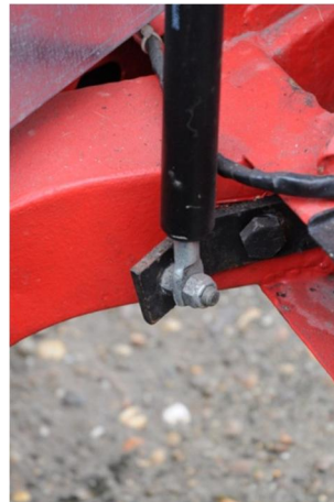
figuur 9 (rechts onder)