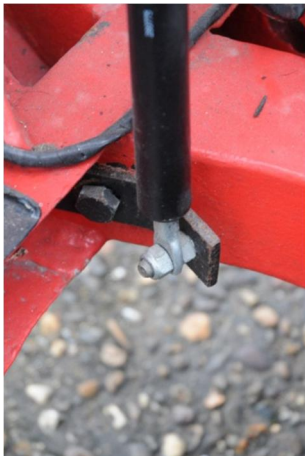
figuur 7 (links onder)