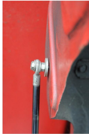
figuur 6 (rechts boven)